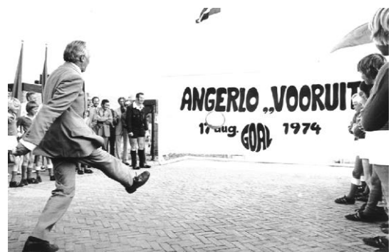
Opening van het complex in 1974 door de burgemeester

In 1992 bestond Angerlo Vooruit 40 jaar. Ter gelegenheid daarvan is op 22 juli 1992 een jubileumwedstrijd gevoetbald tegen Feyenoord.