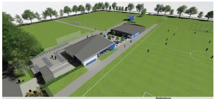
Impressies: Architectenbureau Hurenkamp

Het is de bedoeling dat de bestaande kleedkamers die vast zitten aan het kantinegebouw worden gesloopt. De kantine wordt aan de zuidzijde voorzien van een aaneenschakeling van raampartijen, zodat bezoekers vanaf de kantine rondom over de velden kunnen kijken. Daarmee wordt de sport meer