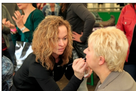
Een van de deelnemers aan het werk

Op de zondagmiddag waren er diverse activiteiten. Van 12.00 tot 14.00 uur beet “ Radio Favoriet FM ” de spits af met een live uitzending van het radioprogramma “ Liemerse Zaken ”. Hierin kwamen diverse Angerlose en Doesburgse zakenmensen aan het woord. Om 13.00 uur begon het Ladies Event met diverse presentaties/workshops op het gebied van beauty, sport, mystiek en creativiteit voor en door dames. De dames van de organisatie verdienen een groot compliment voor het verzorgen van deze middag.