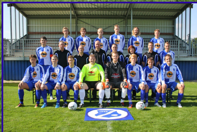
Angerlo Vooruit anno 2012

Voetbalvereniging Angerlo Vooruit December 2012