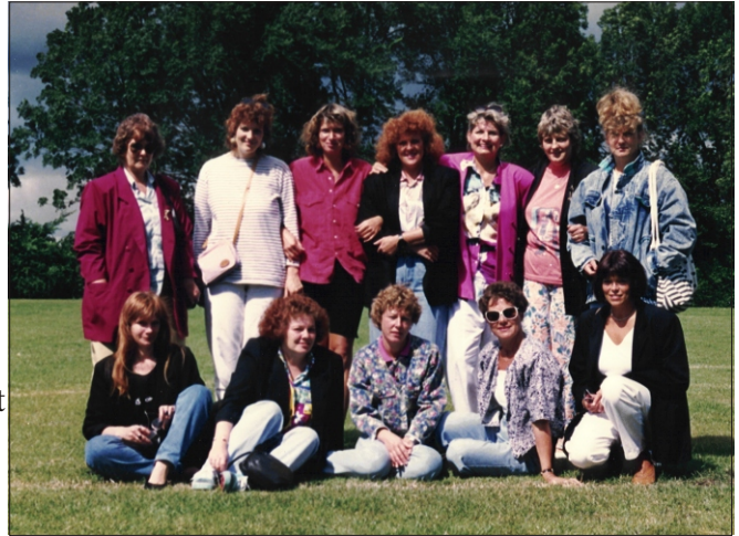
Het schaduwteam van de veteranen, foto Hardenberg 1991