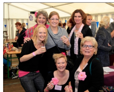
De dames van de organisatie

Voor de mannen was er om 14.00 uur een voetbalwedstrijd tussen de huidige selectie van Angerlo Vooruit en Oud Angerlo Vooruit , dit team o.l.v. trainer Frank van de Pavert had tussen 1989 en 1992 veel succes. Onder andere een promotie en twee kampioenschappen werden er behaald. De oudjes legden soms nog aardige staaltjes voetbal op de grasmat neer, de leeftijd en fitheid van het huidige eerste elftal zorgden ervoor dat er na 2 keer 35 minuten een 13-1 uitslag op het scorebord stond.