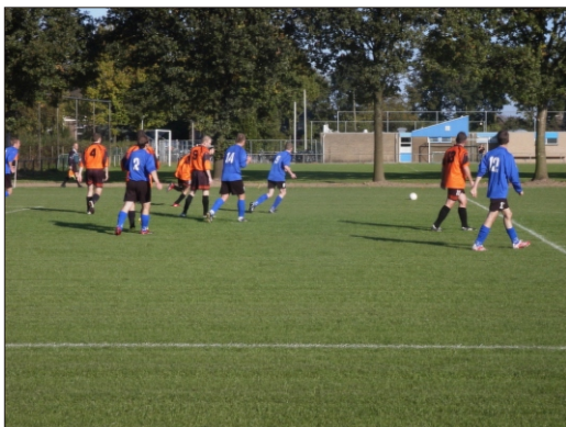
ZAT6 opent het nieuwe derde speelveld