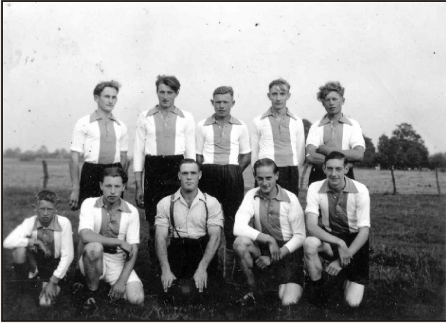
Het Broek de voorloper van Angerlo Vooruit 1951