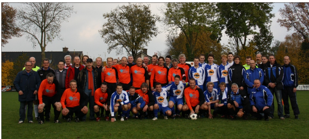
Oud Angerlo Vooruit in oranje shirts