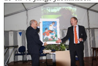
Het cadeau van de KNVB