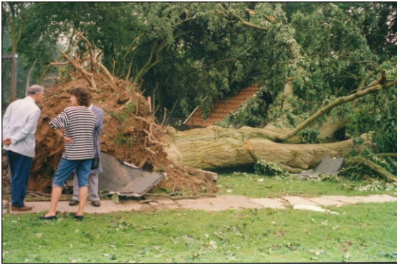
Windhoos 5 juni 1992