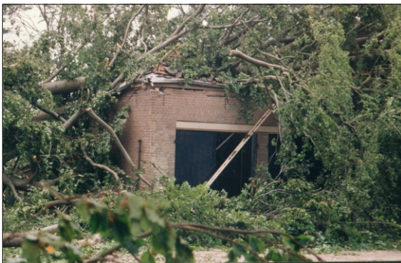
Historie Angerlo Vooruit

Op 5 juni 1992 werd Angerlo getroffen door een enorme windhoos . Deze scheerde op het nippertje langs ons complex en vernietigde alles wat zij op haar weg tegen kwam.