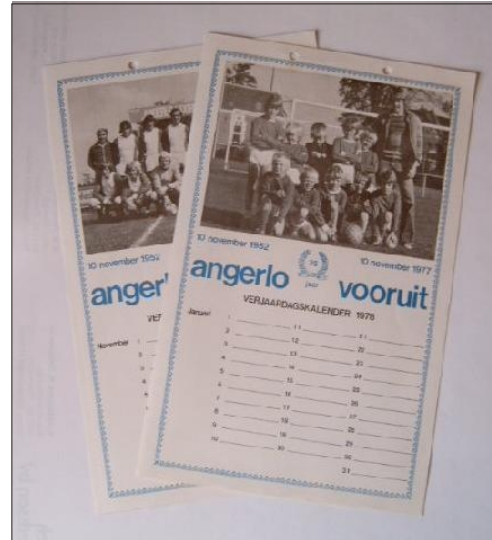
Verjaardagskalender in 1977