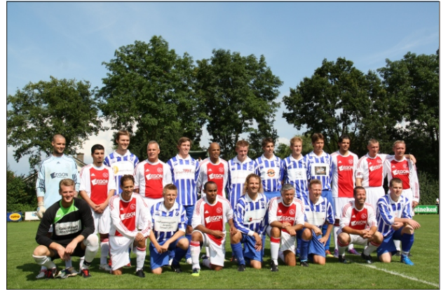
Angerlo Vooruit tweede helft-Lucky Ajax 1-6