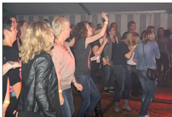
Men had veel plezier

Op de zondagmiddag waren er diverse activiteiten. Van 12.00 tot 14.00 uur beet “ Radio Favoriet FM ” de spits af met een live uitzending van het radioprogramma “ Liemerse Zaken ”. Hierin kwamen diverse Angerlose en Doesburgse zakenmensen aan het woord. Om 13.00 uur begon het Ladies Event met diverse presentaties/workshops op het gebied van beauty, sport, mystiek en creativiteit voor en door dames. De dames van de organisatie verdienen een groot compliment voor het verzorgen van deze middag.