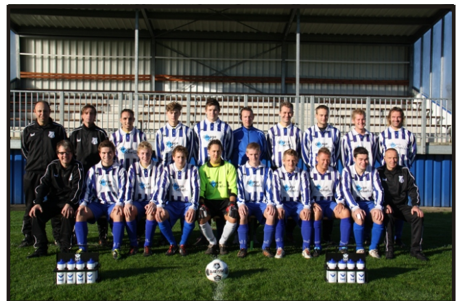
Angerlo Vooruit 2 anno 2012

Aangeboden als dank voor uw medewerking bij het tot stand komen van het historisch overzicht.