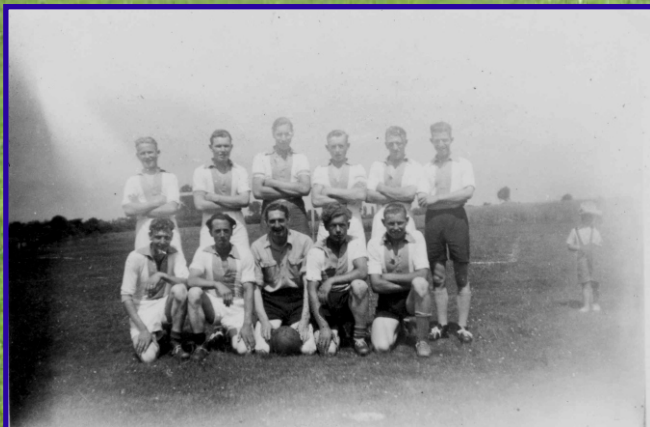
Het Broek de voorloper van Angerlo Vooruit 1951