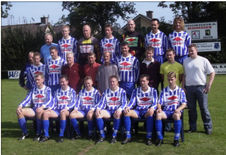
Deze selectie van Angerlo Vooruit behaalde het kampioenschap 2002-2003 in de vierde klas van de KNVB.

Ons 1e team werd in het seizoen 2002-2003 voor de zesde keer kampioen en wel van de vierde klasse van de KNVB en promoveerde naar de derde klasse.