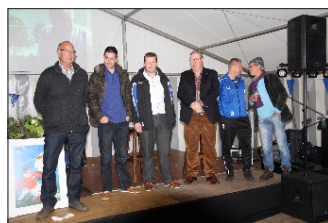
25 en 40 jarige jubilarissen