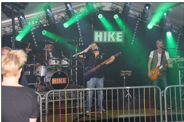
Top orkest Hike gaf een spetterende show

Zaterdagavond was er een groot feest met toporkest HIKE , voor een overvolle tent werd het tot ieders tevredenheid een zeer geslaagde avond.