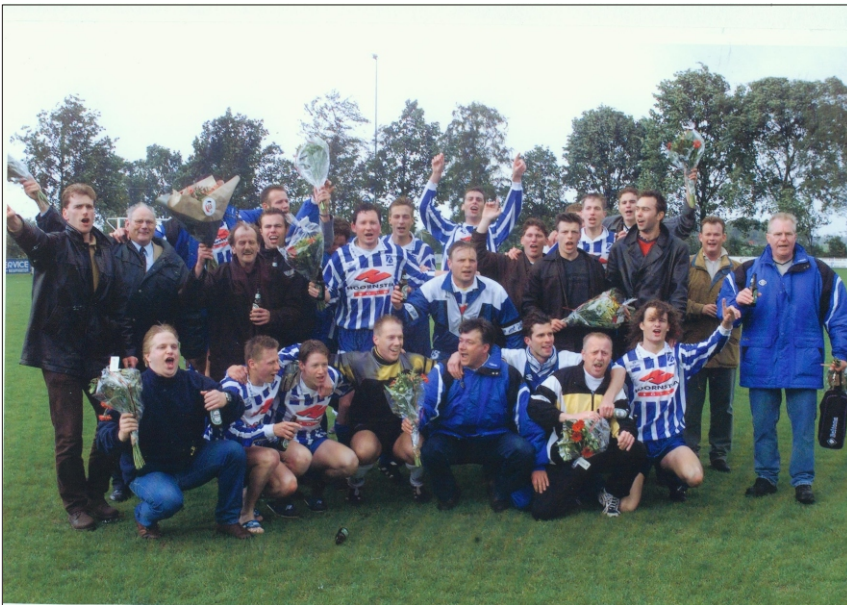
Het eerste elftal dat in het seizoen 1999-2000 promoveerde via de nacompetitie