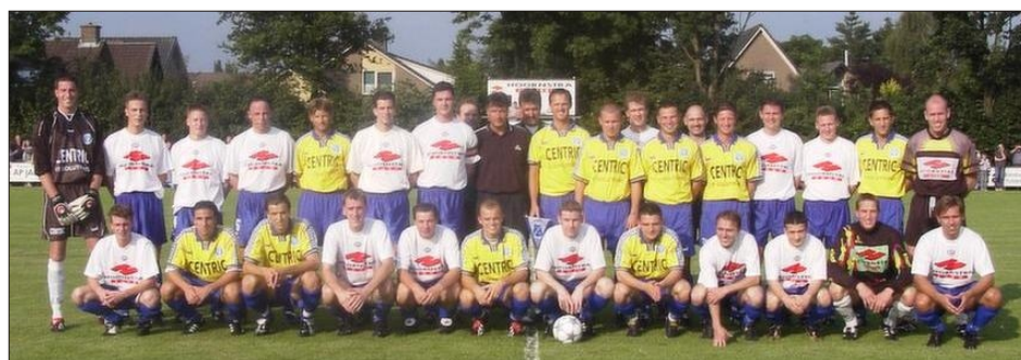
Het Streekelftal (bestaande uit spelers uit de regio en Angerlo Vooruit) met de Graafschap op de foto voor de jubileumwedstrijd