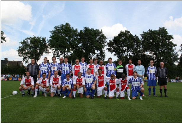
Angerlo Vooruit eerste helft-Lucky Ajax 1-6

In 2012 vierde onze vereniging haar zestig-jarig bestaan. Vanaf het begin van het jaar werd begonnen met het maken van een Angerlo Vooruit film. De interviews voor deze film werden grotendeels gemaakt door Peter van Zadelhoff , oud Angeloër en bekend van RTL7. In het jubileumjaar werden diverse activiteiten gevierd. De eerste activiteit die plaatst vond was de jubileumwedstrijd tegen Lucky Ajax op zaterdag 4 augustus. Het werd een groot succes, bij goed weer kwamen ruim 800 belangstellenden op de wedstrijd af, die helaas voor Angerlo Vooruit met 6-1 verloren ging.